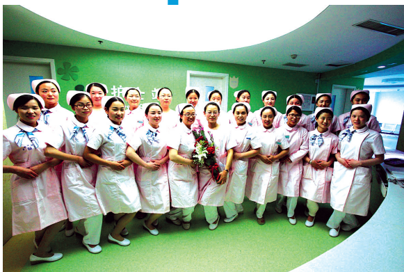
护士节前,护士合影