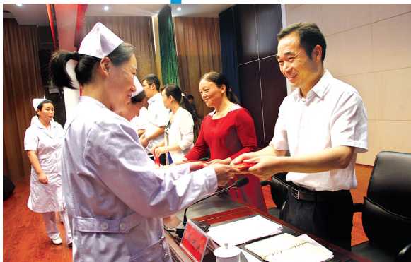
卫计委领导为优秀护士颁奖