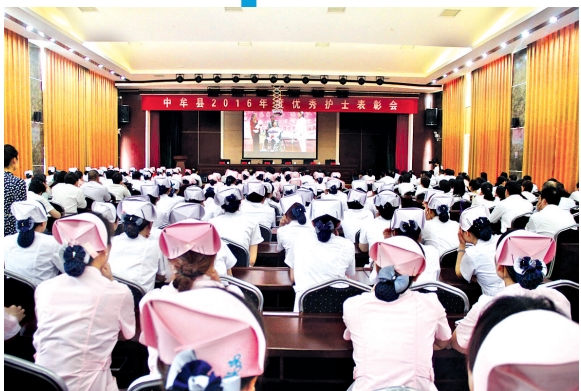
护士节表彰大会现场正在观看影片