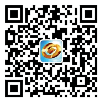
兴业银行郑州分行