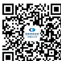
国泰君安证券河南分公司