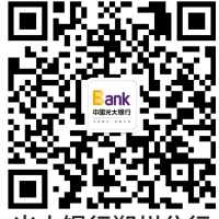
光大银行郑州分行