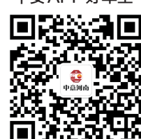
中意人寿河南省分公司