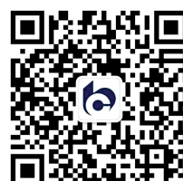
交通银行河南省分行