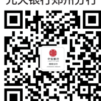
中信银行郑州分行