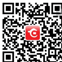
华夏银行郑州分行