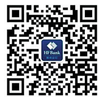
恒丰银行郑州分行