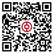
中国银行河南分行