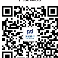
浦发银行郑州分行