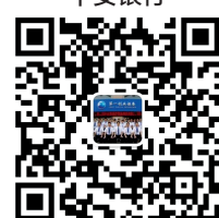
第一创业证券郑州部