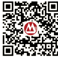
招商银行郑州分行