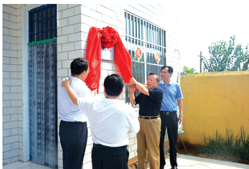
黄店镇首个慈善工作站成立