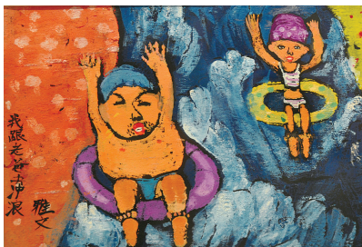
新儿童画《我跟爸爸去冲浪》作者 雅文