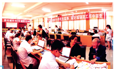
城镇职工卒中筛查现场