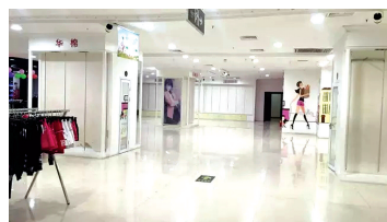
新店2楼空旷的商场

近日,本报接新密多家商户反映,称新密金博大新店从今年3月份起,款项一直未结。由于倒闭的传言,商户们担心追债无门。据悉,新密金博大注册为“新密金博大购物中心有限公司”,与郑州金博大并无瓜葛。其管理方回应,新密金博大新店亏损3500万,但是老店正常营业。该负责人说:“对于欠款我们认账,不过需要时间。”对此,商户们表示质疑:“这么大的商超,连几千块的货款都给不起?”