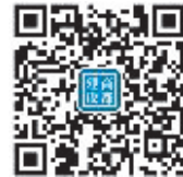
商都建设周刊 订阅号

街道办,各设计、建设、施工、监理、劳务等建设主体单位和近2000个工地。通俗讲,读者就是省会郑州“管工程的”和“干工程的”。