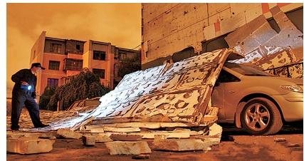
建筑外保温层脱落砸伤了汽车 资料图片

本报讯 按照规定,7月1日起,全市新建建筑原则上应全部采用建筑保温与结构一体化技术设计、建设。届时,我市建筑保温技术将实现“穿棉袄”到“穿铁布衫”的升级。郑州晚报记者 冉小平 通讯员 吕春侠 文/图