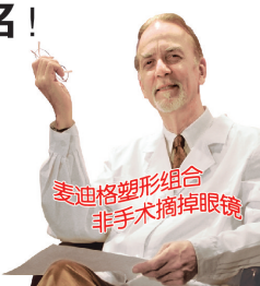
麦迪格塑形组合 非手术摘掉眼镜