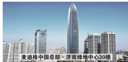
麦迪格中国总部·济南绿地中心30楼

专家、顶尖学府、和眼科门诊等机构保持着良好的合作关系。美国隐形眼镜协会、华盛顿视力低下关爱中心、英国穆尔菲尔德医院、加拿大Visionary Eye联盟、宾夕法尼亚眼视光学院……众多全球顶尖的权威机构和麦迪格一起为中国近视患者提供专业的视光服务。