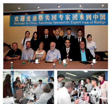
正技术不仅可以让学生恢复正常视力，还会防止新的近视再次产生，控制近视度数不断增长。”

针对笔者关于麦迪格塑形组合安全性及效果稳定性的提问，专家们也给出了专业的解答，他们告诉笔者：“麦迪格塑形组合是一种物理矫正方法，不会对眼睛及角膜带来任何伤害，他的安全性甚至高于普通隐形眼镜。对于长期效果来说，麦迪格塑形组合是专门针对中国学生用眼量大的问题而设计的，是角膜塑形镜的一种升级，这种组合矫