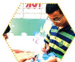
老师,请给我签个字