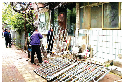
蜜蜂张街道拆除康复后街违章栅栏

为贯彻落实全市5月20日城市精细化管理工作会议精神，加大对纳入全市10条最差路段和12个最差乱点的集中整治，二七区辖区被点名的各街道办事处迅速召开了专项整治会议，对整治工作周密安排部署，科学制订整改细化方案，从根本上解决该区域“脏乱差”问题，达到周边市容整洁、秩序良好、交通通畅的整治目标。目前，均已取得不错的效果。