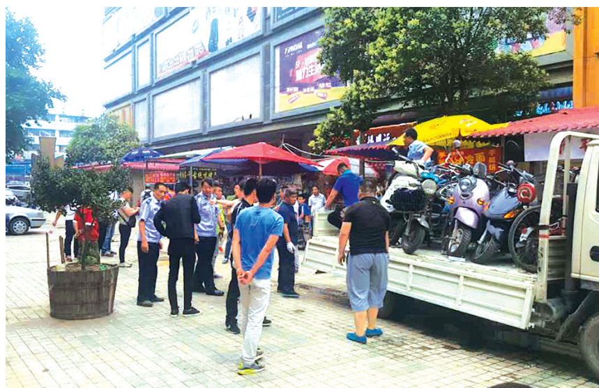
德化街街道连续多天租用卡车进行乱点治理

截至目前,街道共清理摆放非机动车乱停放900余辆,清理占道经营、突出店外经营问题227处,暂扣物品364件,清理乱贴乱画1000余处次,清运垃圾76处次,辖区市容环境得到有效改善,切实提升了城市管理水平。