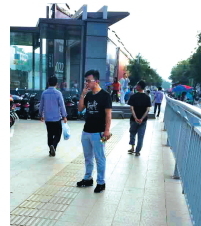
解放路街道正兴街地铁口整改后