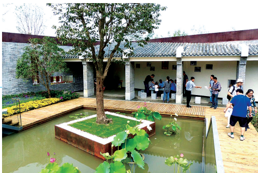
游人在参观“郑州院子”