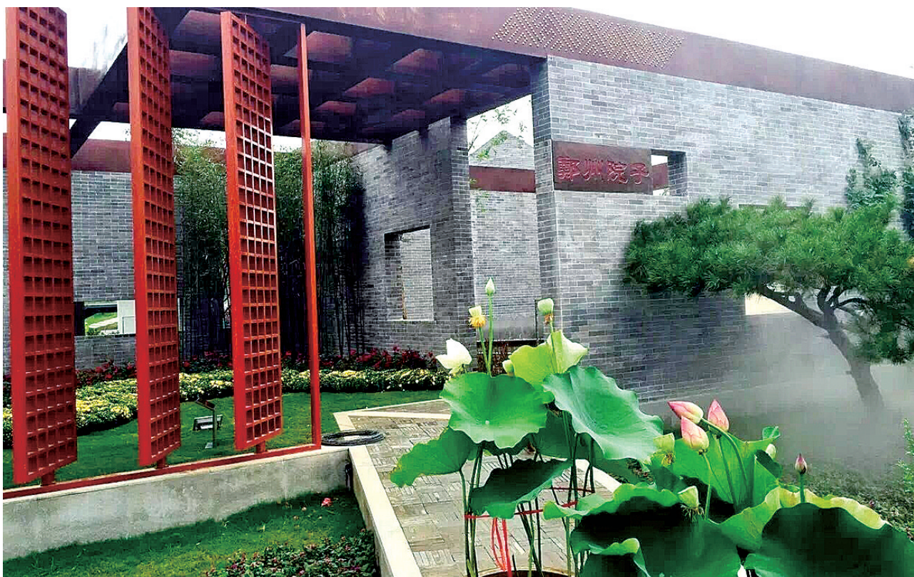
别具特色的郑州作品“郑州院子”