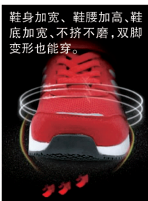
鞋身加宽、鞋腰加高、鞋底加宽、不挤不磨，双脚变形也能穿。

足力健老人鞋独有的头等舱设计，专给大骨节部位释放更多的空间，穿上后既感觉宽敞舒适，又合脚跟脚，给老人头等舱的享受，走路轻便，再也不疼！