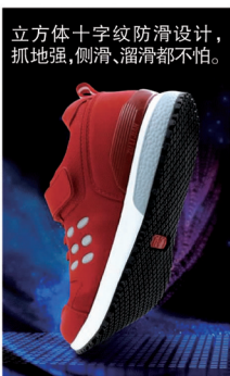
立方体十字纹防滑设计，抓地强，侧滑、溜滑都不怕。

足力健老人鞋采用泰国天然橡胶底和十字纹立方体防滑专利技术，鞋底就像有 200 个小吸盘一样，踩到光滑石头上，踩在水面上，甚至踩在油面上也不会“滑”，有了足力健老人走到哪都放心，保证老人不摔跤！