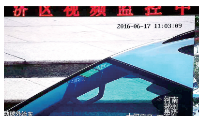
连车辆张贴的年检标识字样都能看清

本报讯 2016年1月,总投资5000余万元的平安郑州惠济区视频监控中心建成使用。目前,惠济区广布高清视频监控探头已有2000余个,立体治安防控网已具雏形。截至6月20日,惠济区视频监控中心通过监控视频直接抓获各类违法犯罪嫌疑人27人,通过分析研判,为各类案件提供有力支撑,间接抓获11人。监控中心运行以来,强力打击各种违法犯罪行为,案件同比下降10%。 郑州晚报记者 张玉东 通讯员 刘国保 张倩/文图