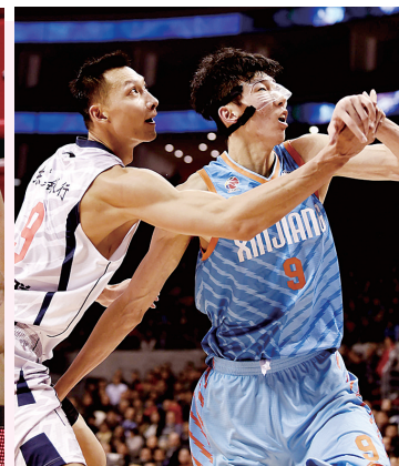
易建联与周琦在CBA比赛中拼抢