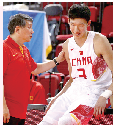
2014年,主教练宫鲁鸣与周琦交流