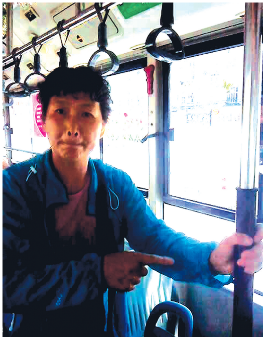
女士教育女贼:偷我你是“碰着了”