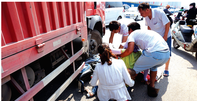
热心群众把3人从车下救出

本报讯 26日上午,秦岭路西站路口东南角,一辆拉水车在右转弯时将同向行驶的一电动车卷入车下,电动车上3人连同电动车被死死卡在拉水车下。一过路小伙扔下自己的电动车跑上前去救人,救出3人后悄然离去。