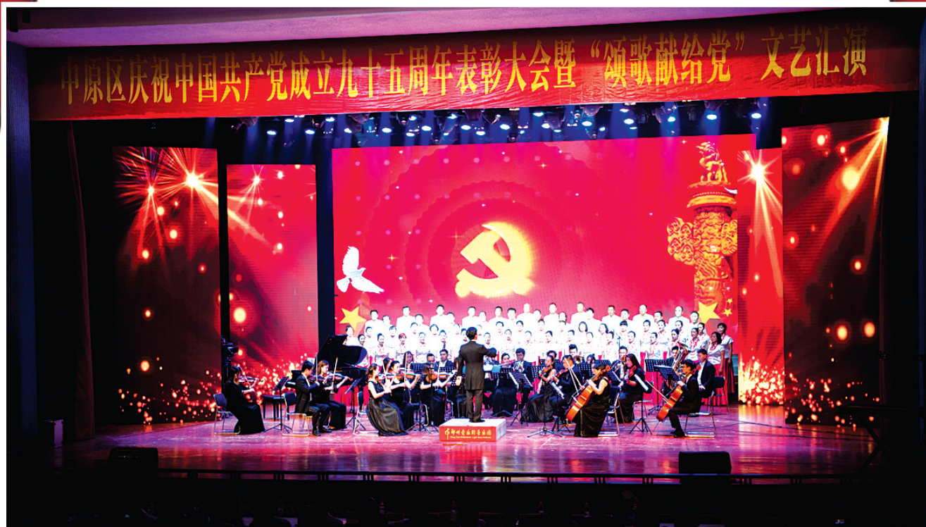
在郑州爱乐乐团演奏的交响乐《红旗颂》中,庆“七一”文艺汇演拉开帷幕

2016年是“十三”五的开篇之年,又恰逢中国共产党建党95周年、红军长征胜利80周年。为纪念中国共产党建党95周年,回顾党的灿烂历史,缅怀党的光辉业绩,6月25日,中原区庆祝中国共产党成立95周年表彰大会暨“颂歌献给党”文艺汇演在市青少年宫举行。区四大班子及县处级领导出席汇演现场,同各街道、区直各单位党员代表1000余人观看演出,共同庆祝伟大的中国共产党95岁华诞。