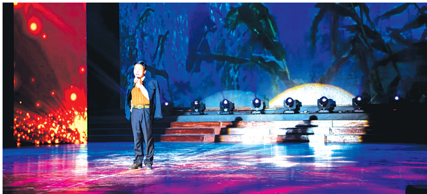
戏曲音乐剧《人民焦裕禄》选段《做一名人民满意的好党员》