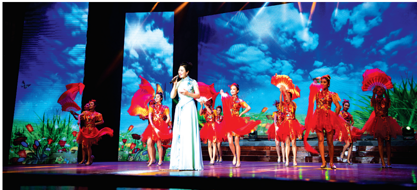
女声独唱《美丽的日子》