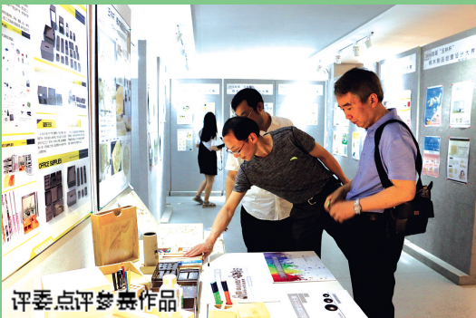
评委点评参赛作品