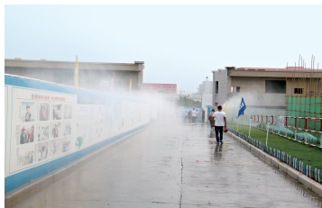
项目部喷淋设备正在正常运转