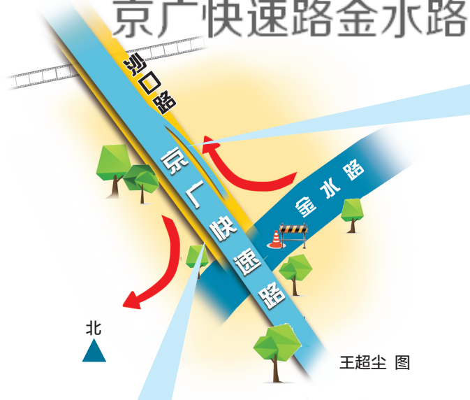
京广快速路金水路口东侧上桥匝道同步恢复开通