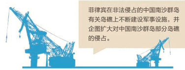
菲律宾在非法侵占的中国南沙群岛有关岛礁上不断建设军事设施,并企图扩大对中国南沙群岛部分岛礁的侵占。

17 90年代,菲律宾继续在非法侵占的中国南沙群岛有关岛礁修建机场和海空军基地。