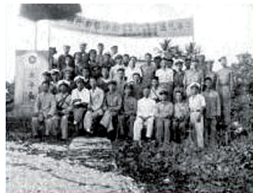
1946年12月,中国政府派接收专员及官兵在太平岛上举行仪式,收复南沙群岛

6 二战结束后,中国收复南海诸岛并恢复行使主权,世界上许多国家都承认南海诸岛是中国领土。