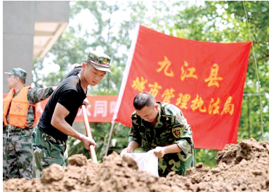
装沙袋排沙袋加固大堤