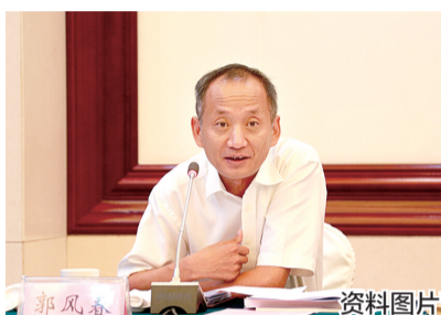
郭凤春 省住建厅副厅长