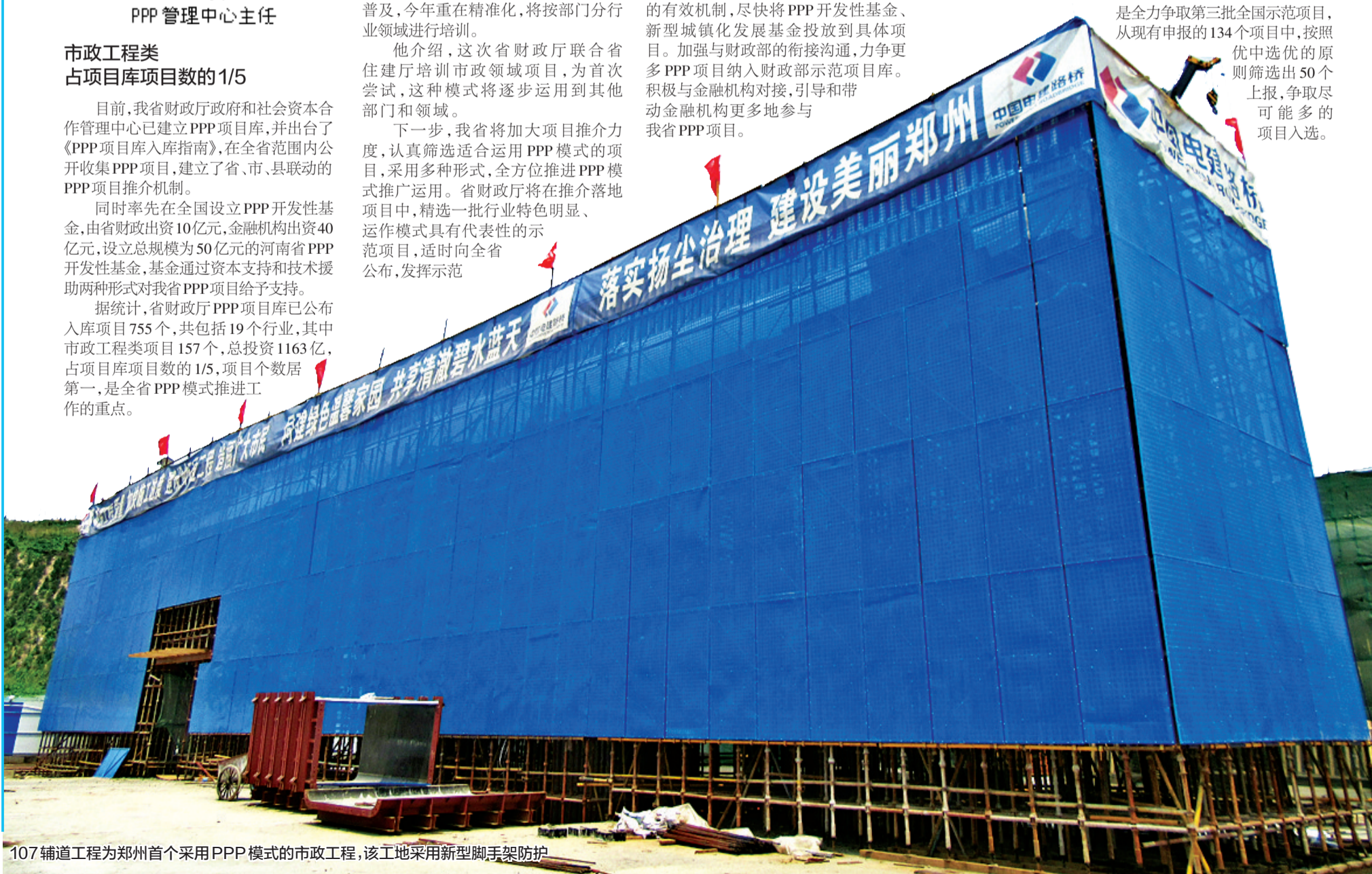
107辅道工程为郑州首个采用PPP模式的市政工程,该工地采用新型脚手架防护

今年我省还将做好扶持政策的落实。省财政厅将研究征集项目和管理的有效机制,尽快将PPP开发性基金、新型城镇化发展基金投放到具体项目。加强与财政部的衔接沟通,力争更多PPP项目纳入财政部示范项目库。积极与金融机构对接,引导和带动金融机构更多地参与我省PPP项目。