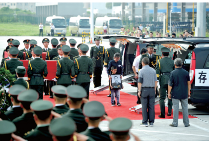
灵柩将运往烈士生前部队所在地许昌

据悉,两名维和烈士遗体告别式将于21日上午10点在烈士生前所在部队第20集团军杨根思部队的所在地许昌举行,之后,两位烈士将被安葬在各自家乡。