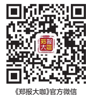
《郑州大咖》官方微信