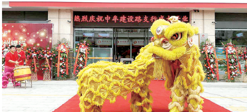
开业当天市民围观舞狮表演

7月19日上午,郑州银行中牟建设路支行开业仪式隆重举行。郑州银行中牟建设路支行全体工作人员、金融单位和企业界代表等参加了开业仪式。