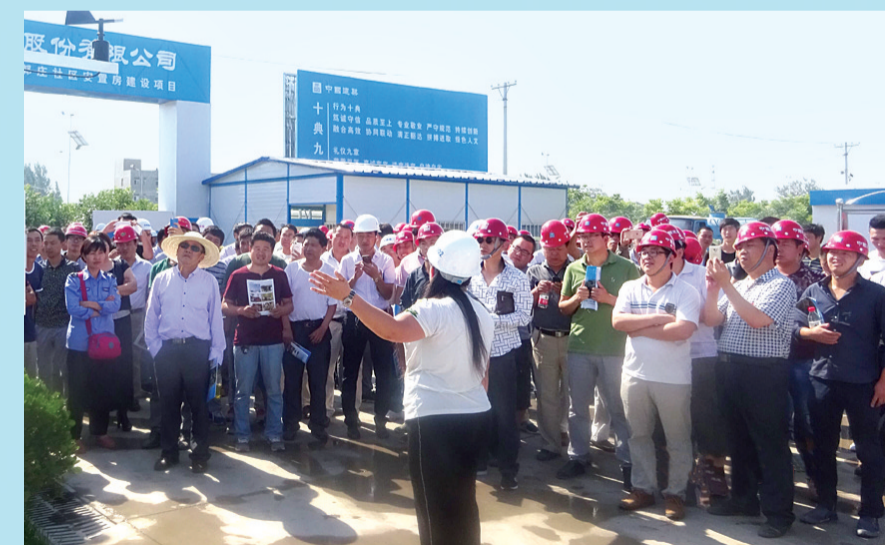
郭庄社区观摩现场

(五)依法治尘。当前,全国上下对大气污染、扬尘治理工作高度重视,相关法律法规逐步完善。3法2规范是开展建筑工地扬尘治理工作的规范标准和实施行政处罚的法律依据。不管是监管部门,还是工程参建各方,都要认真学习,严格遵守,坚决落实。