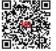
扫一扫 全景航拍看陈寨