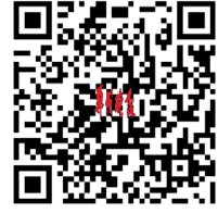
扫一扫 看航拍小浪底调水调沙