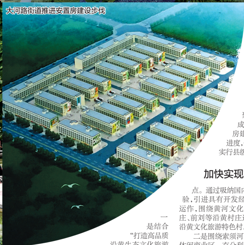
大河路街道推进安置房建设步伐