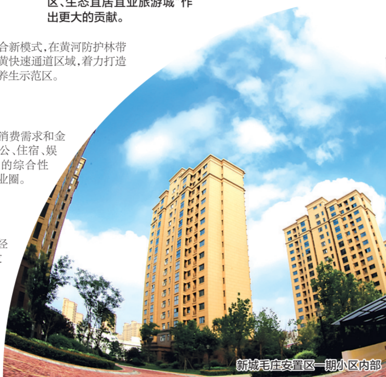
新城毛庄安置区一期小区内部

深化“两抓一保”和“两学一做”,以服务群众为宗旨,充分发挥党组织战斗堡垒和党员先锋模范作用。一是强化班子建设。坚持中心组集中学习制度,加强科级干部分包联系村、社区、重点项目和企业制度,帮助解决实际问题。二是规范干部队伍。制定机关绩效考核管理办法,对缺岗、离岗、不作为等违反工作纪律的,实行末位问责制。三是创新工作载体。积极推进辖区单位共驻共建活动,探索大工委、大党建工作格局,深化“五星党员”评比、“一刻钟服务圈”等活动,完善党建微信公众号,为党员开展活动、学习交流提供平台。