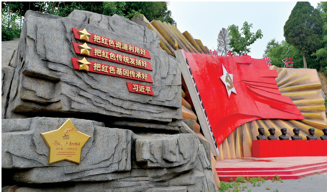
1934年11月11日,著名的“花山寨会议”在这里召开,决定红二十五军立即实行战略转移。它就像遵义会议一样,成为决定红二十五军前途和命运的转折点,后来有人将此次会议称作“小遵义会议”。

在罗山县何家冲,矗立一棵长势茂盛的白果树,距今已800余年,它见证了1934年11月16日2980名红二十五军先遣队将士出征的场面,也是我们重走红军长征路采风活动的一个重要节点。站在当年红二十五军长征集合动员小广场,面对老白果树下巨型红军长征纪念浮雕,脑海中仿佛响起“红军不怕远征难,万水千山只等闲……”眼前会浮现出这样的一组场景:泸定桥边、大