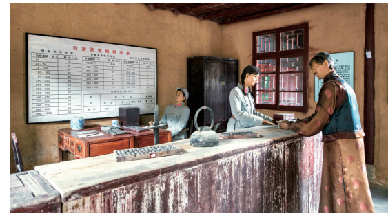
当年鄂豫皖苏区税务总局成立后,为鄂豫皖革命根据地和苏维埃政权的巩固发展作出了重要贡献。