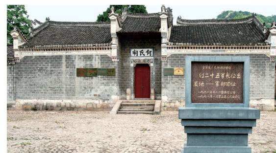
1934年11月16日,红军第二十五军2980多位将士从罗山县何家冲出发,告别鄂豫皖根据地开始了长征。