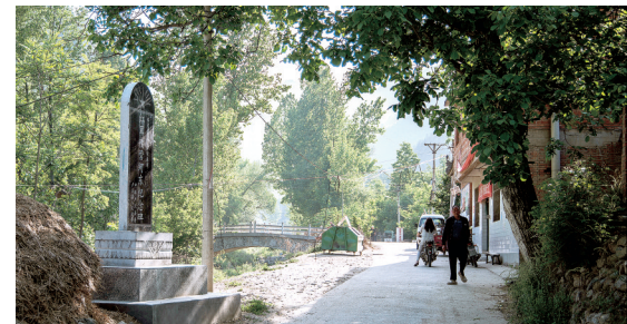
红军某部转战卢氏山区时,曾在风雪夜悄然宿于河东村百姓屋檐下,纪律严明对百姓秋毫无犯,后人立碑纪念。