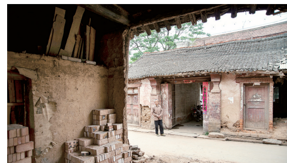
卢氏文峪乡文峪村红军驻地遗址