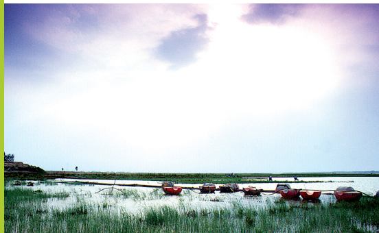
金色的阳光打在草丛间,如金子般珍贵