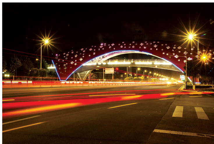
白天热闹街道,此时安静如水