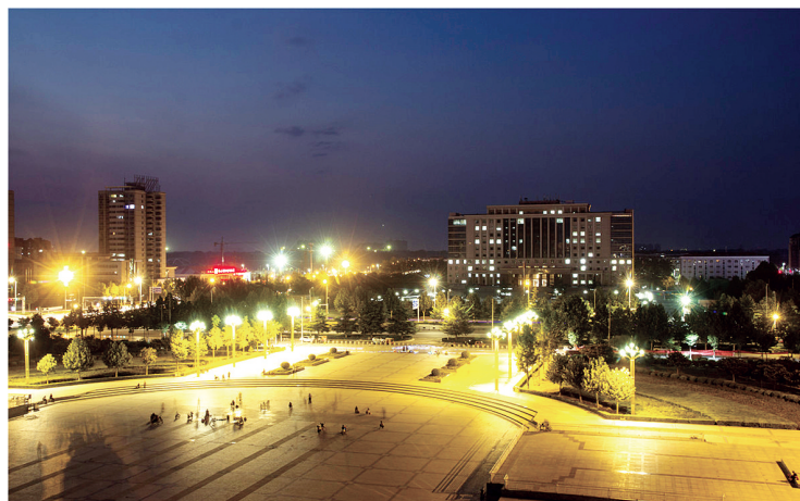
广场上的人们,在享受着夜晚的静默