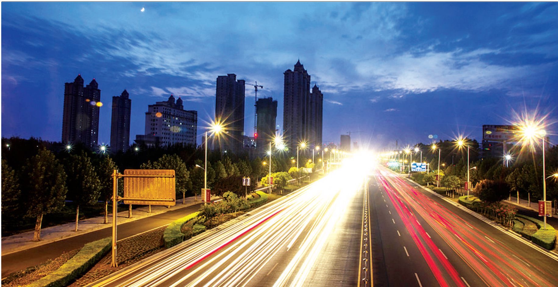
夜幕刚刚降临,商都大道上流光溢彩