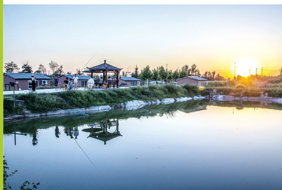
夕阳、湛蓝色的湖面、悠闲的人们……