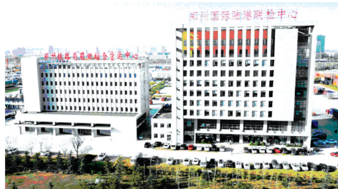
河南自贸区经开片区内的郑州国际陆港联检中心

未来三年,经开区将以河南自贸区、跨境电商综试区建设为契机,搭平台、建通道,加快建设河南自贸区重要功能区,提高国际化水平,为郑州对外开放和经济社会发展做出新的贡献。