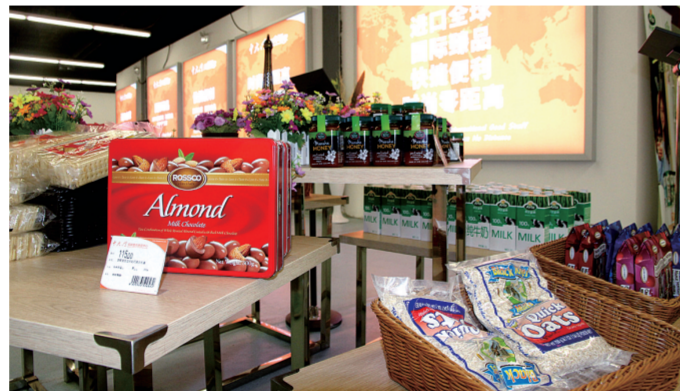
河南自贸区经开片区内的中大门保税直购体验中心