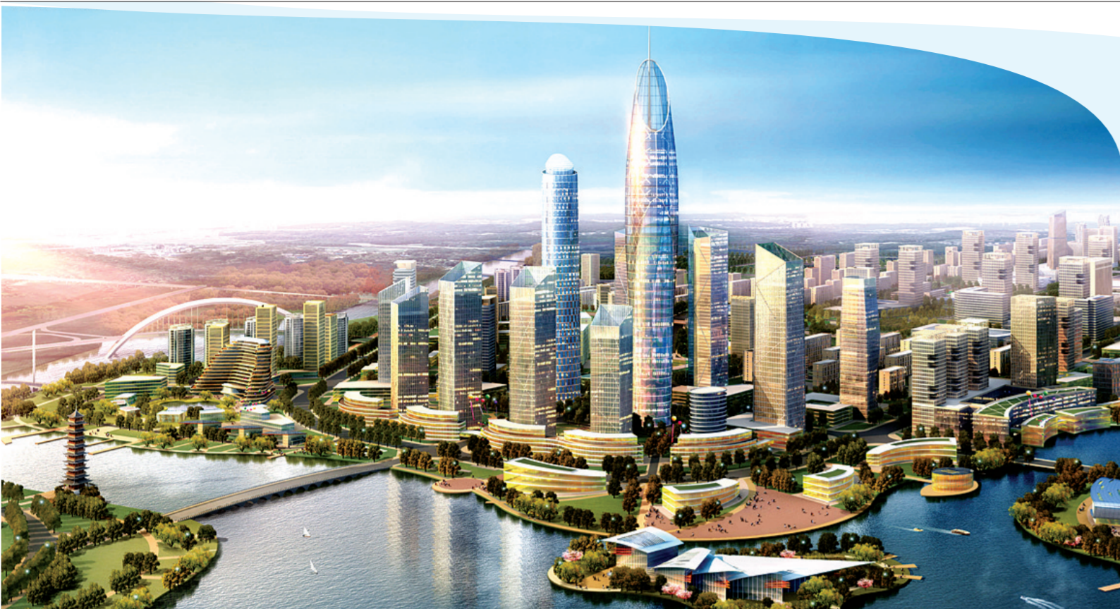
河南自贸区经开片区内的滨河国际新城