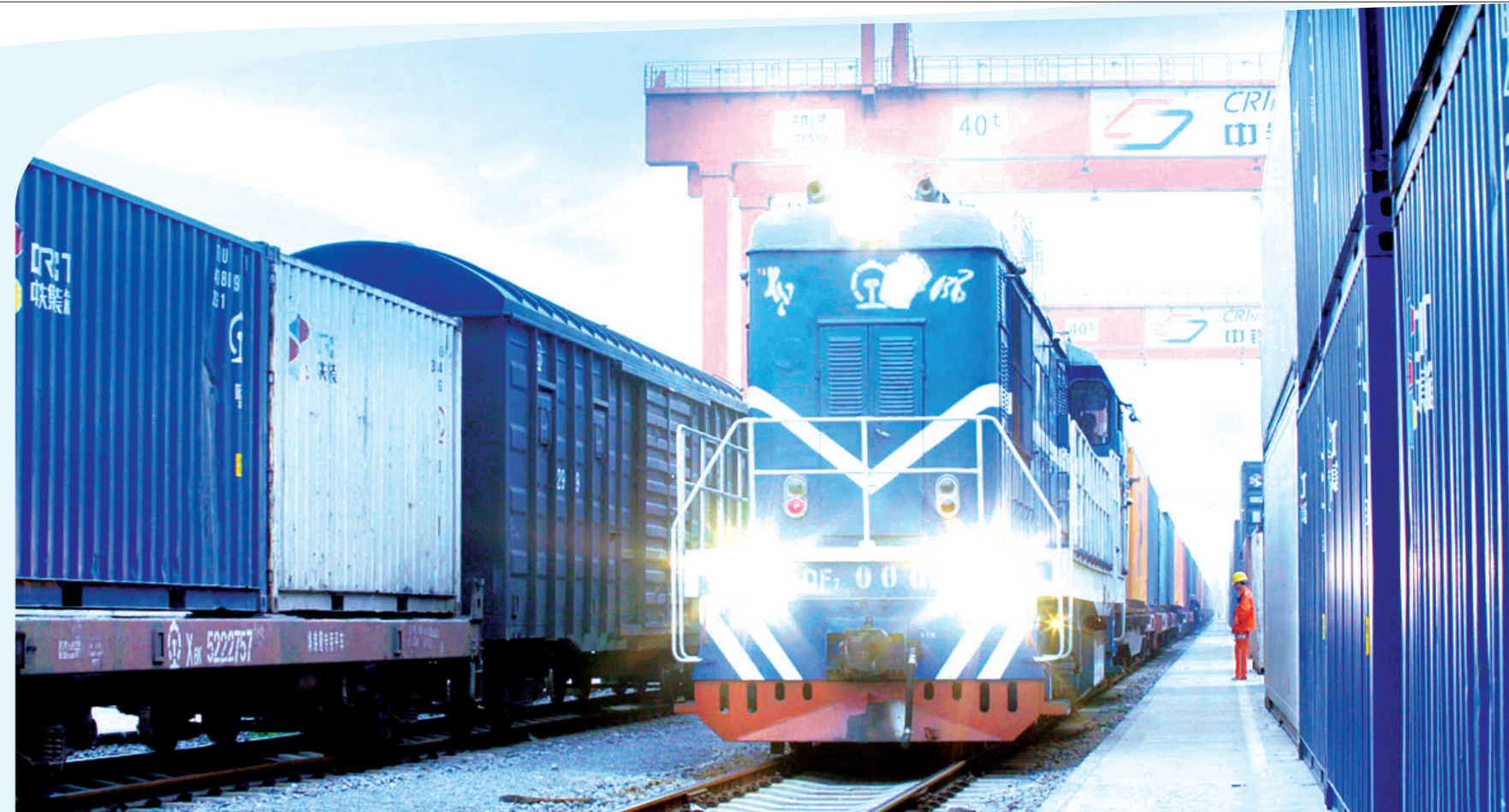
河南自贸区经开片区内的郑欧班列