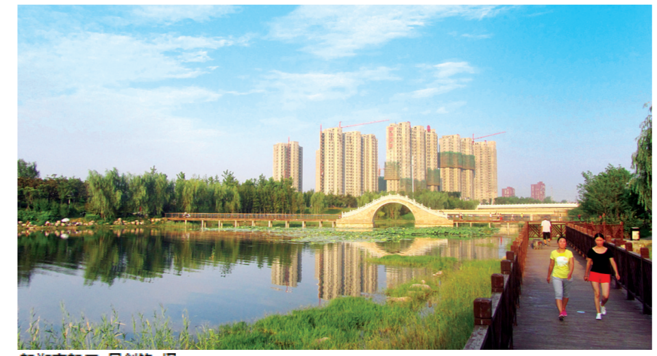
新郑市新区 吴剑锋 摄