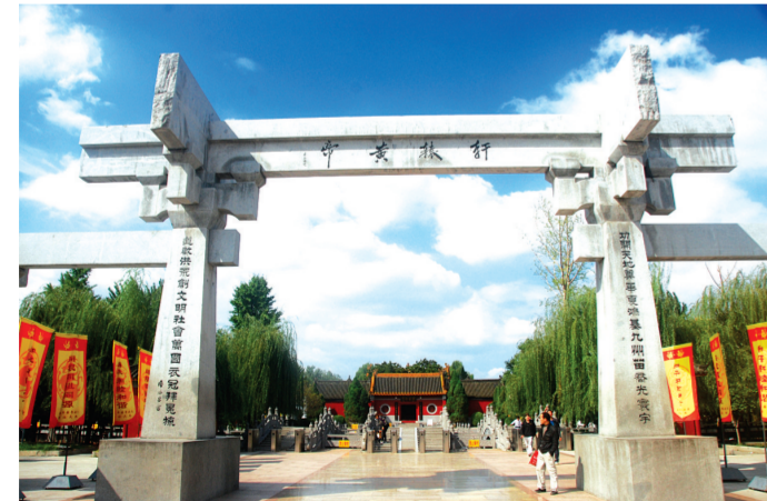
黄帝故里