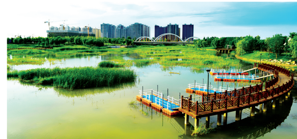
轩辕湖成为市民的好去处