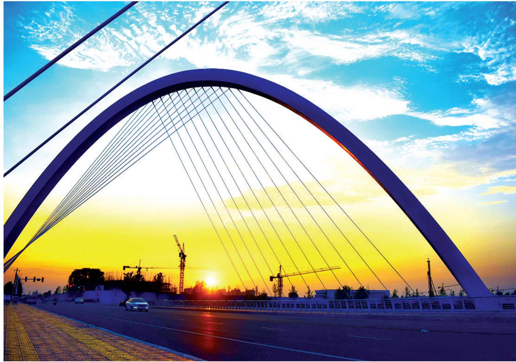
新郑市新区 沈磊 摄

今天,新郑格外纯洁、美丽,人们一看到她心情就会好起来。她是谁?她就是大新郑的天空! 清晨,新郑的天空敞开胸怀迎接万道霞光,眨眼间每一个角落都被染成了红色。透过云层,阳光洒向大地,唤醒沉睡的万物。朴实的新郑人民从沉睡中醒来,开始美好的一天…… 傍晚,夕阳西下,给天空披上了多彩的外衣。美丽的天空一次又一次记录下新郑靓丽的今天。 蓝天并不是偶然因素,它是新郑人关心和呵护的结果。那种简单的蓝,那种自然的蓝,那种纯真的蓝,是你来了随时都可以看见的。 新郑的蓝天是最美的风景,蓝蓝的天空上飘着朵朵白云,云卷云舒里,构成一幅幅醉人的画卷。蓝宝石一样湛蓝深幽的天空,像孩子的瞳孔一样清澈。明亮的颜色,看一眼就令人心旷神怡。雪花一般纯白圣洁的云,像一块诱人的棉花糖,又似飘飘洒洒的蒲公英,伸手随便剪裁一块儿,轻轻地扬起手,随风吹去。郑风苑里翠绿的荷叶随风飘荡,荷香满苑。 人们喜欢秋天,多半来自对秋色的迷恋。秋天来了,空气变得爽爽的,天特别的干净,特别的蓝,一朵朵的云彩悠闲地飘来飘去。秋天的季节里,常常被一种浓浓的怀旧情绪所左右,就好像在睡眠不好的时候,如果躺在一张很旧的小床上,就可以安然入睡一样,解释不清为什么,但是效果却是显见的。最近有闲的时候,若你去轩辕湖逛一逛,她一定优雅地回应你,“你看到的我是蓝色的!” 走在新郑市湿地公园的甬道上,阳光下有黄的橘红的叶子不时落下,她们像一颗颗不再光艳的生灵,带着无奈的放弃,带着不尽的回忆,带着不舍的情怀,带着美好的憧憬,退出了那个曾经充满着生机与绚丽的舞台;她们像一只只疲倦的蝴蝶失去了亮泽,僵硬了美丽而脆弱的翅膀,有气无力随风飘逸,而最终投入了大地的怀抱,苦心修炼来等待着属于她们的下一个季节。 新郑秋日的阳光温馨静谧,少了夏季的狂野。挂在淡蓝色的天空,不温不火,如穿久了的棉质内衣,软绵绵、暖融融包裹着躯体,就算凉风掠过,心底也会生出舒适安逸,令人忘记世俗喧嚣,忘却宠辱得失。静静地坐着,只留那一念回旋,便觉有足够的热力烘托着心灵向更高的层次,实现微妙的腾飞。如果你置身于新郑市黄帝故里景区,一定会被她的美景震撼。蓝天、白云、红墙、灰瓦组成了一幅水彩画。 新郑秋日的阳光色调恬淡,随意取一处风景,变幻的淡淡色彩犹如轮廓光,勾勒出景物的细部,让恬静的田园风光,像画面分割有序,有着十足优美的版画效果,只觉太阳那淡淡的七彩,已把秋的风韵在大地上勾画了一幅淋漓尽致的美景,令人心旷神怡,无限遐思。 新郑时报 李显文 邓春丽