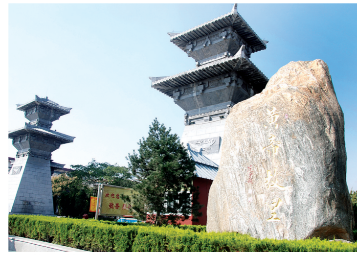
庄严故里