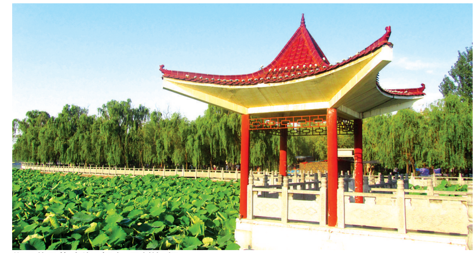
郑风苑里荷叶随风摇曳