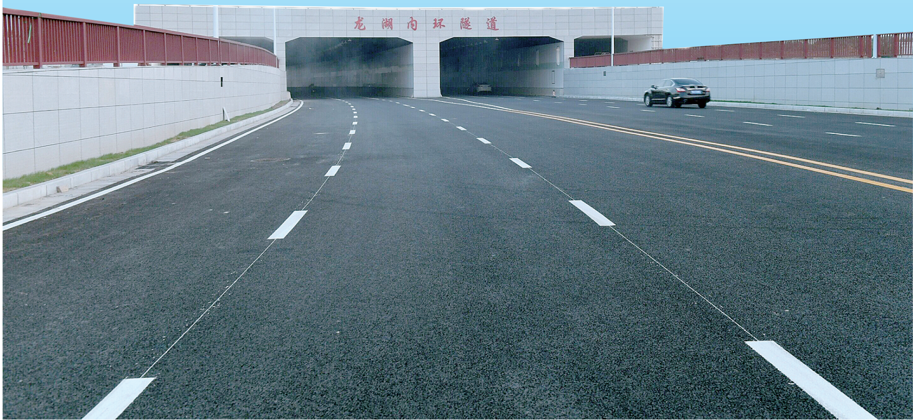
龙湖内环路具备通车条件