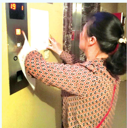
去小区粘贴活动通知