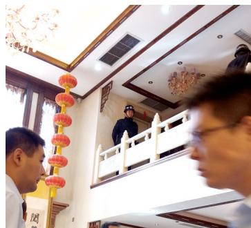
别墅内精美的装饰