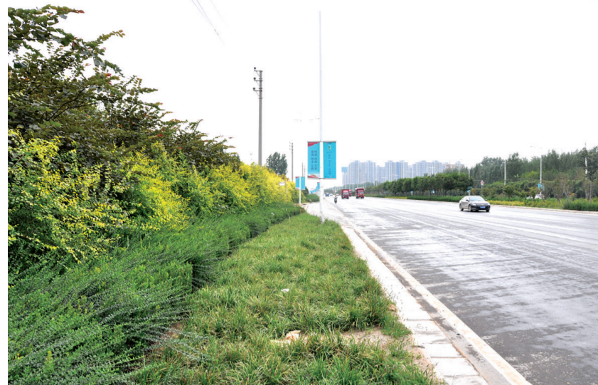
四港联动大道生态廊道