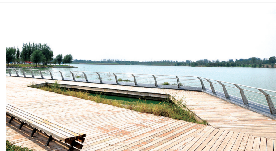
蝶湖风光(经南八路十五大街向西一公里)