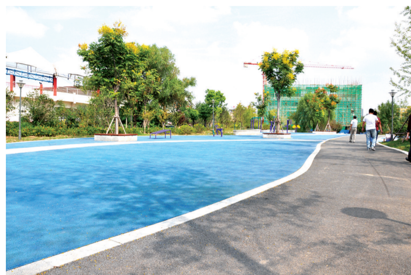
尚岗杨公园·活动场