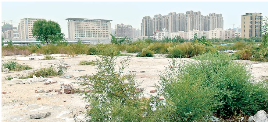
项目地块上的附属物已清理

青少年公园项目位于郑州市农业路以南、丰产路以北、东三街以西、天明路以东。2013年,为解决中心城区绿地偏少、分布不均的矛盾,郑州市委、市政府决定在中心城区规划建设27个区级综合性公园,青少年公园是其中之一。