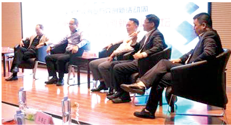
创业投资与创新创业论坛在高新区举办

创新成就梦想,创新引领未来。10月12日,2016年河南创业投资与创新创业论坛活动在高新区中原广告产业园盛大举行。作为河南双创活动分会场之一,本次论坛以“创投·创业·创新”为主题,来自全国知名投资机构同创伟业、松禾资本、赛伯乐、德同资本的投资人及双创方面的政策专家,在企业如何拓宽融资渠道、吸引风险投资及双创政策解读方面,为现场嘉宾提供富有价值的意见指导和智力支持。