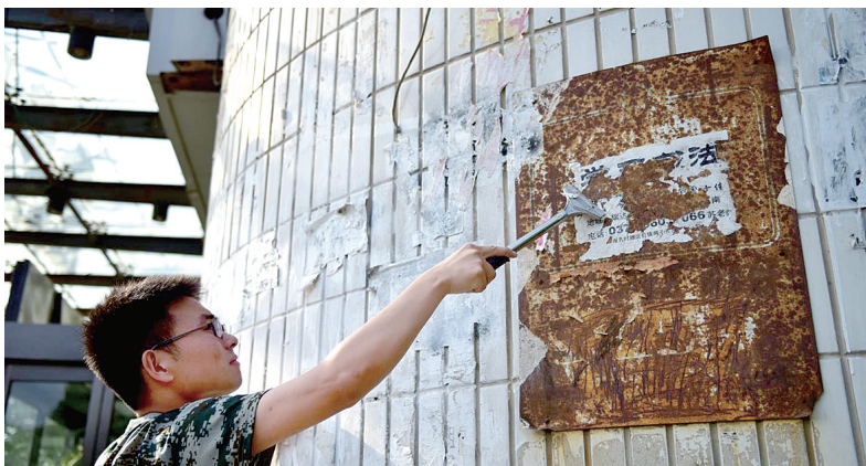
工作人员正在清理小广告

同时,郑州市城管局将督促尚未完成“城管电话语音追呼系统”设置工作的单位加快速度,尽快完成投入使用,与现行系统形成“合力”,使违法张贴、喷涂“无处藏身”,从源头根治城市小广告的泛滥。