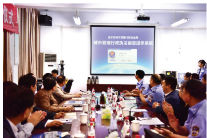
郑州市推广语音追呼系统