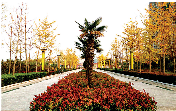
轩辕湖广场公园 新郑时报 李显文