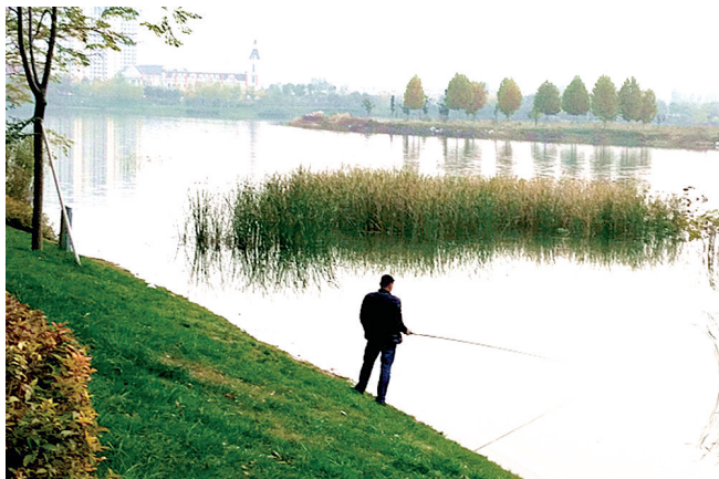
秋日垂钓 新郑时报 李显文

秋天的世界洋溢着独特浓郁的秋韵，怡然留下自己深沉的足印和浓厚的气息。在新郑这个小城市，安静舒适、淡雅脱俗，走在北区轩辕湖公园的小路上，一树树的金黄、鲜红迷住了路过人的眼，纷纷拿出手机定格那一刻的美丽。