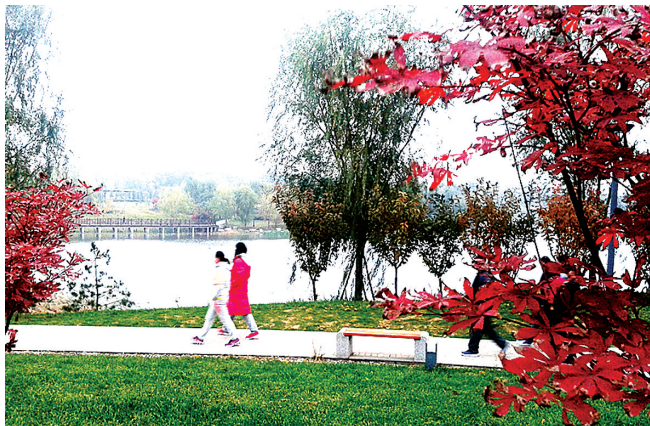
散步 新郑时报 吴俊锋