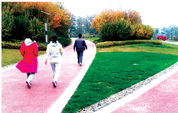
一起跑步欣赏美景