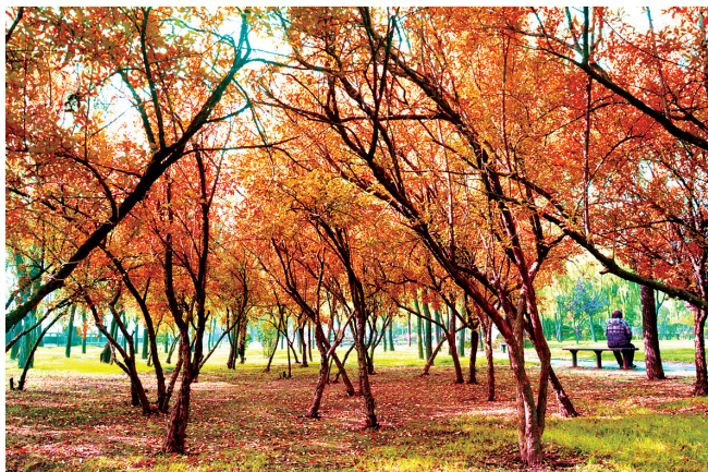
红色丛林 新郑时报 巴明星