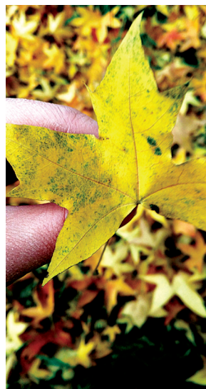
快乐时光 新郑时报 李显文