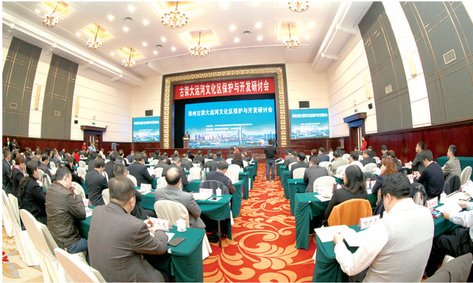
古荥大运河文化区保护与开发研讨会现场