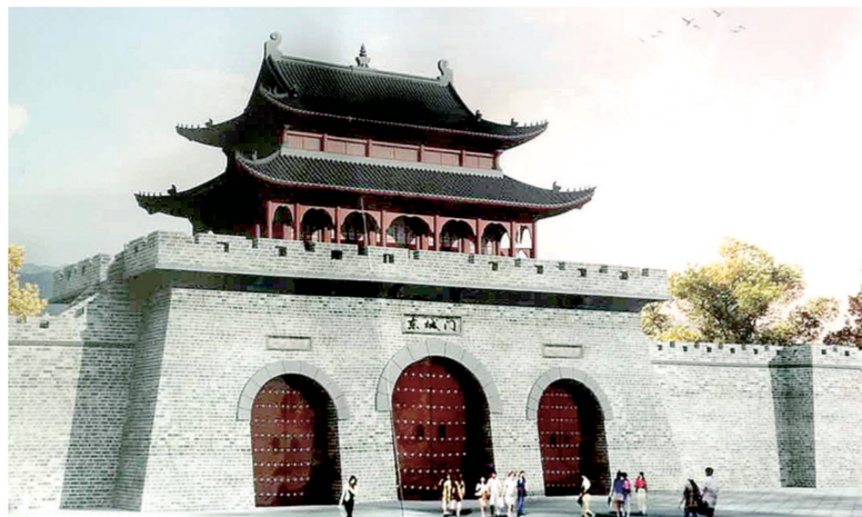
古荥东城门效果图