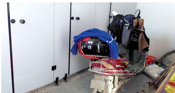
有人在闲置公厕给电动车充电