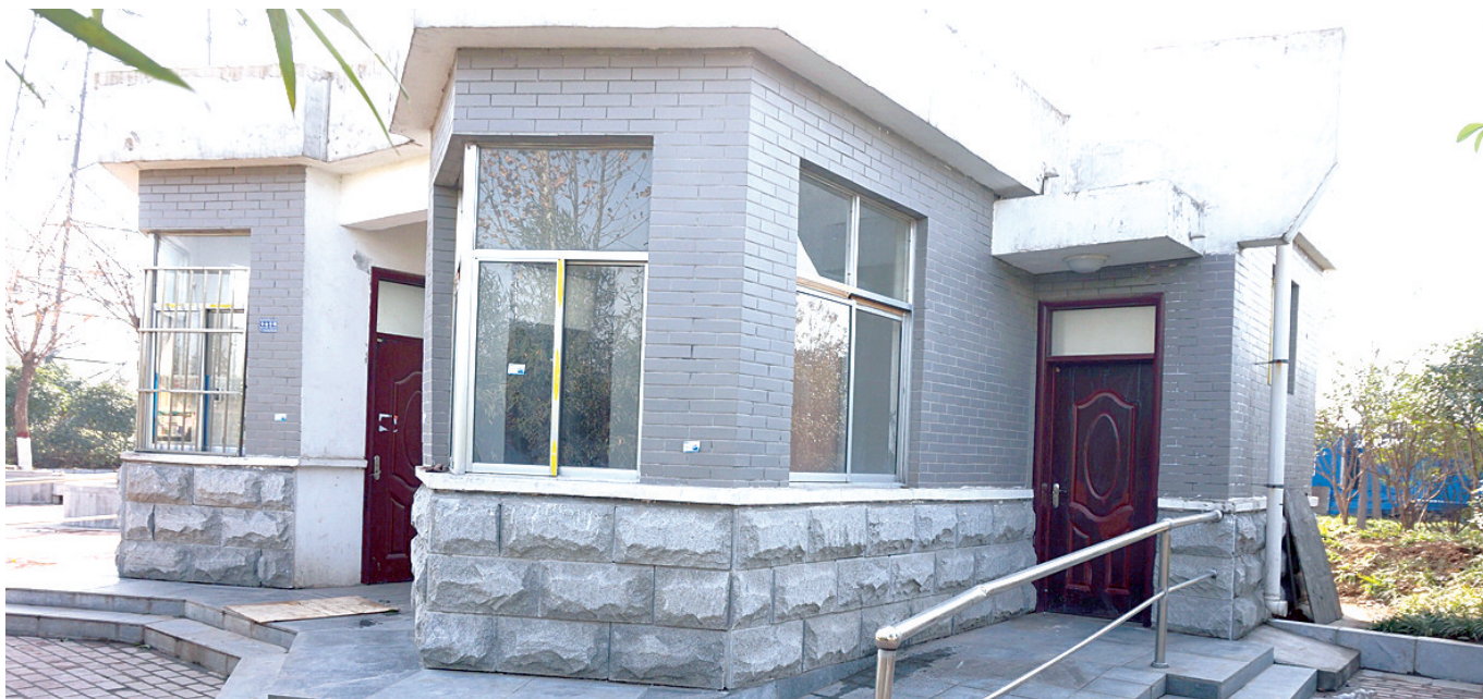
外观漂亮的公厕锁着门

昨日下午,高新区市政局绿化科朱科长称,化工路生态廊道内的厕所已经完工,具体让一家公司管理,进行社会化运营。至于不开放的原因,等调查后再决定如何处理。