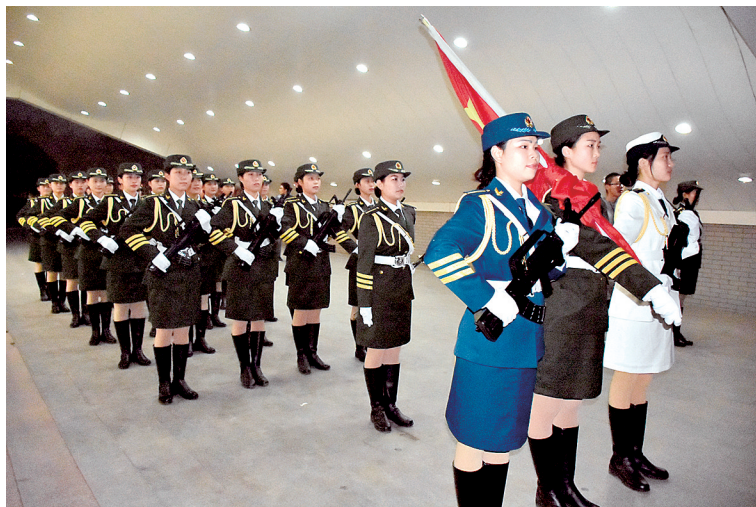
女子国旗护卫队整装待发