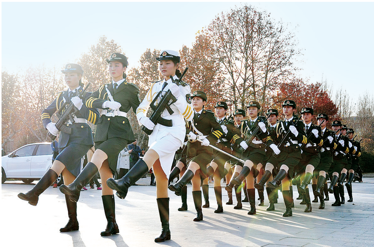
女子国旗护卫队正在进行升国旗前最后一次训练

走过7个多月的挥汗如雨,历经两百多天的魔鬼式训练,12月5日清晨,郑州大学国旗护卫队女子方队终于踏上护卫国旗的道路,进行第一次升旗,接受着全校师生的检阅和仪式的洗礼,五星广场前,升旗台旁,一抹亮丽橄榄绿让人惊艳。