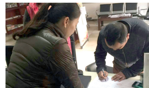
如意湖办事处与物业签订目标责任书