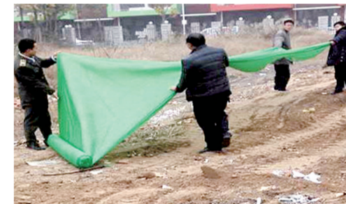
商都路办事处清理垃圾、组织覆盖