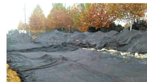
如意湖办事处治理黄土裸露

据悉,此次行动期间,如意湖办事处纪检监察室和长效办加强督查,保证所有人员按时到岗,认真履责,切实以“不放过任何一个污染源、不放过任何一个薄弱环节、不放过任何一个隐患黑点、不放过任何一个整改不到位的问题”落实整治目标到位。