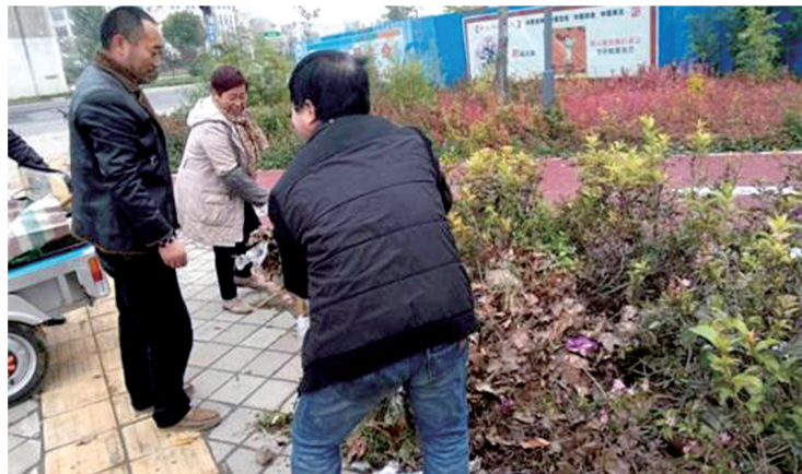
博学路办事处清理卫生死角

以住宅小区、单位公共区域的卫生死角、积存垃圾清理为重点,安排城市管理机动中队全辖区不间断巡查治理,督促辖区建筑工地对项目内部及周边路面做好环境清理。