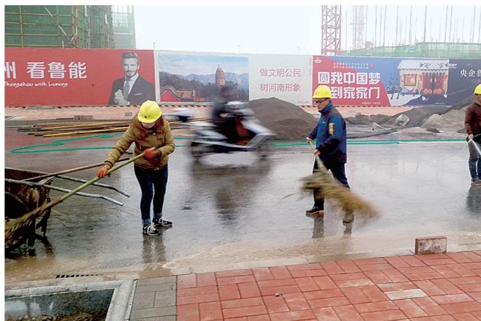
博学路办事处清扫建筑工地出入口

据了解,为确保大气污染防治工作常态有效,郑东新区管委会、大气办督导组、扬尘办、执法局、各乡镇办事处等多部门联合,从11月13日至17日开展了4次“建筑工作零点夜查”行动,检查工地195家。在部门联合、多措施并举、多态势强力推进下,郑东新区空气质量有效提升,截至11月20日,郑东新区PM10平均浓度值为128,PM2.5平均浓度值为69,均满足年度目标要求,空气质量优于全市平均水平。