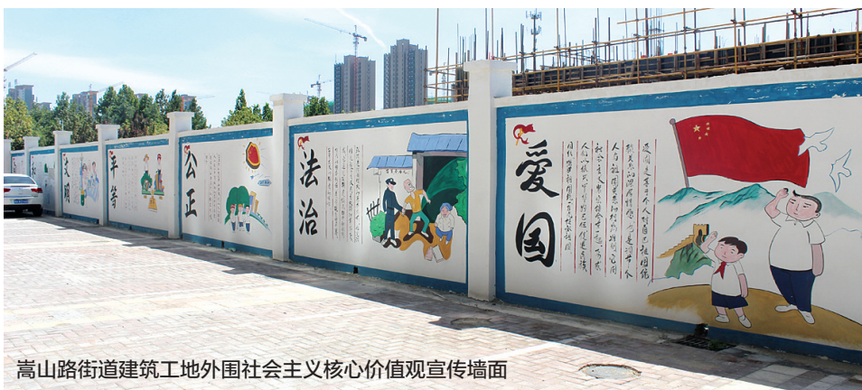
嵩山路街道建筑工地外围社会主义核心价值观宣传墙面

街道开展“好邻居”评选、“文明楼道”评选,发放“邻里亲情卡”等特色活动,开展“十星级文明户”评比挂牌活动及和谐家庭、好婆婆、好媳妇评选活动。同时积极开展全民阅读活动,在辖区举办了青年读书会、读书节等,在潜移默化中提高居民群众的思想修养和道德品质。