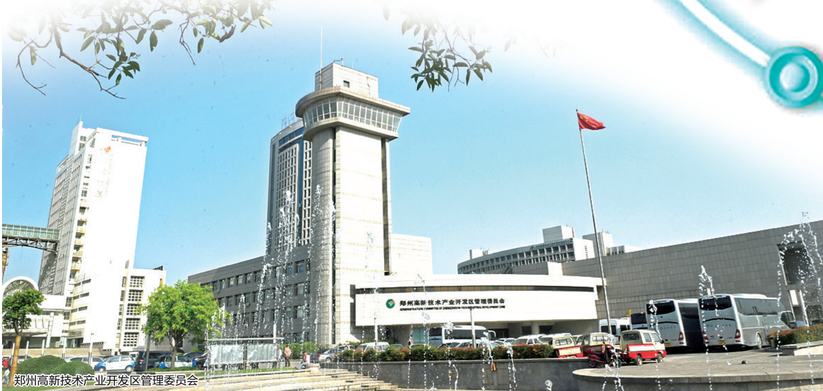
郑州高新技术产业开发区管理委员会

继惠济万达11月18日开业之后, 郑州第5座万达广场将落户高新区, 总投资40亿元。随着今年郑州房地产市场的火爆, 高新区的表现也十分抢眼, 有多个大的住宅项目入市, 并遭到疯抢, 但是与住宅销售火爆形成鲜明对比的是, 区内至今没有一个现代化的、成体系的商业综合体。此次郑州高新万达广场项目签约, 可满足高新区群众对商业的迫切渴望。据知情人士透露, 郑州高新万达广场项目位置在科学大道与垂柳路的交会处。当天台上签约的分别是大连万达商业地产股份有限公司、河南晟和祥实业有限公司和高新区管委会三方。河南晟和祥实业有限公司是福晟集团和谦祥集团合作共同打造钱隆城项目而量身打造的一家公司。从签约方来看, 郑州高新万达广场项目将落户到钱隆城项目内。同日高新区签约的还有另外11个项目, 总投资255亿元。