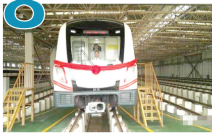
地铁1号线二期工程试跑

2016年9月20日上午11时, 随着第一列电客车缓缓驶出凯旋路停车场, 进入正线区间试运行, 郑州市轨道交通1号线二期工程正式跨入试运行阶段, 离2017年春节前开通试运营目标又进了一步。届时, 1号线二期工程将与一期工程贯通, 进一步缩短城市东西方向的时空距离。郑州市轨道交通1号线二期工程在一期工程的基础上, 分别向西、向北延伸, 线路全长约15.0km, 设站10座, 其中西段线路由西流湖站向西延伸7个站, 东段线路由市体育中心站向北延伸3个站。据工作人员介绍, 所谓试运行就是在城市轨道交通工程冷、热滑试验成功的基础上, 系统联调顺利完成, 通过不载客列车运行, 对运营组织管理和设施设备系统的可用性、安全性和可靠性进行检验。简单说就是空载按图跑车。据了解, 目前试运行已经结束, 2017年1月15日, 将载客试运营。