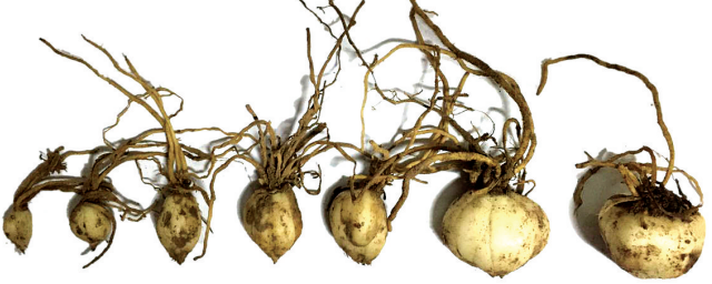
三年育种 六年长成 九年出精品