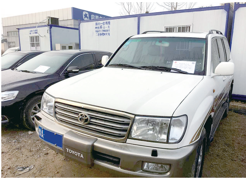
本次拍卖中,起拍价最贵的车辆——陆地巡洋舰

负责此次拍卖的河南拍卖行有限公司负责人介绍,此次开拍的车辆,有陆巡、帕拉丁、奥迪、帕萨特、雅阁、天籁、别克、凯美瑞、迈腾、桑塔纳、现代等车型,共计191辆。与之前多批次车型相比,此次开拍的车型较新,车况较好,其中,最贵的是一辆2004年7月登记的陆巡,起拍价12.6万元;最便宜的是一辆2003年1月登记的普桑,起拍价只有3000元,性价比还是比较高的。其他车辆,起拍价都在1万~3万不等,价格较为亲民。与此前拍卖不