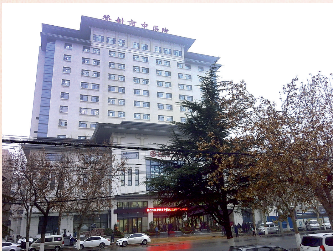
中医院门诊综合楼试营业

巍巍高山脚下,华夏天地之中,闪耀着一颗璀璨的明珠——登封市中医院,一所深受老百姓欢迎的医院。