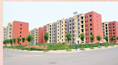
中心镇区冶南社区

巧夺天工大手笔,浓墨重彩绘新城。我们有理由相信:一个美丽、繁华、宜居、宜业、宜游的大冶新姿正展现在嵩岳大地上。