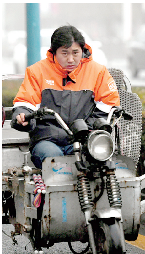
花园路徐寨路口,快递小哥雾霾中疾行