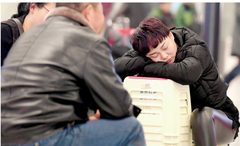
板凳当枕,先睡一觉再说。

迁、建筑工程配套道路和管沟开挖作业,裸露场地增加洒水降尘频次。 截至1月4日下午,市商务局共得到18座元旦节假日期间抽检的加油站油品检测结果,其中1座加油站的油品疑似未达到国五标准,立即下达整改通知书,责令其立即停业整顿。 航空港实验区针对督查发现的问题,责令责任单位即刻完成整改。比如,明港办事处刘店村,近期拆除的房屋废墟没有覆盖防尘网,目前已整改。 目前,我市大气污染防治工作各相关单位依然在督查中。郑报融媒记者 王军方