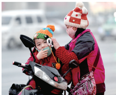
省电视台西门 一位家长给孩子戴上口罩和耳罩