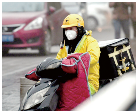
畜牧路上,一位小哥送外卖