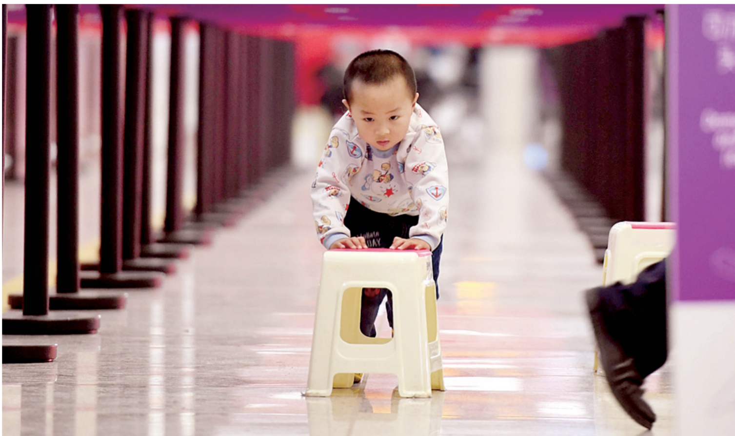
昨日下午,受大雾影响,新郑国际机场大部分航班取消,机场增设了近千个小板凳和一些供水点,应对旅客候机需要,图为小朋友推着小板凳玩耍。昨晚8点,机场航班恢复正常起降。

本报讯 降雨过后,郑州的能见度依然很低。昨日白天,雾霾始终笼罩着郑州和很多北方城市。从空气质量指数上看,郑州的空气质量正在逐步好转,但大雾却因湿度等原因而迟迟不散。今天,是二十四节气中的小寒,将有偏北风3至4级,希望能吹走雾霾。